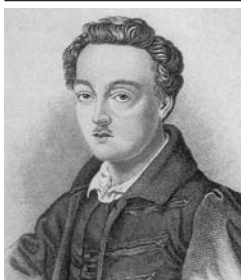
Georg Büchner AUTOR

Georg Büchner, geboren 1813, studierte Medizin, Naturwissenschaften, Geschichte und Philosophie. In Gießen schloss er sich der radikalen Freiheitsbewegung an und gründete 1834 die "Gesellschaft für Menschenrechte", um die reaktionären Verhältnisse in Hessen zu ändern. 1835 musste er wegen seiner politischen Flugschrift "Der Hessische Landbote", in der er zur Revolution gegen die Obrigkeit aufgerufen hatte, ins Straßburger Exil gehen. Georg Büchner starb 1837 in Zürich. Büchners kurze schriftstellerische Laufbahn war geprägt von revolutionärem Elan ("Dantons Tod"). Mit "Woyzeck" erweist er sich als Vorläufer des Expressionismus. Er war zu seiner Zeit ein Außenseiter, wurde jedoch für viele Dichter nach ihm zu einem Vorbild: Hauptmann, Brecht oder Max Frisch.