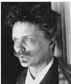
August Strindberg AUTOR

Johan August Strindberg wurde am 22. Januar 1849 in Stockholm geboren. Er begann ein Medizinstudium in Uppsala, versuchte sich als Schauspieler und arbeitete vor seinem Durchbruch als Schriftsteller als Journalist und Bibliothekssekretär. Die 80er und 90er Jahre des 19. Jahrhunderts verbrachte er überwiegend in Frankreich, der Schweiz, Deutschland, Dänemark und England, um dem Hohn und der Kritik der konservativen schwedischen Öffentlichkeit zu entfliehen. Er beschäftigte sich neben der Schriftstellerei mit Malerei, Fotografie, Naturwissenschaften, Alchemie und Okkultismus. 1896 kehrte er nach Stockholm zurück und fand endlich breite, wenn auch nicht ungeteilte, Anerkennung als Schriftsteller. 1907 eröffnete er in Stockholm das "Intime Theater", eine Kleinbühne, für die er seine berühmten Kammerspiele verfaßte. Strindberg starb am 14. Mai 1912.