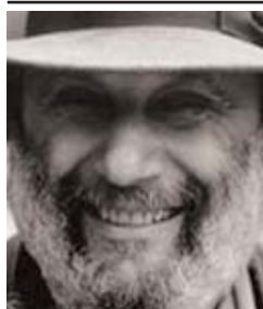
Murray Schisgal AUTOR

Murray Schisgal wurde 1926 als Sohn russischer Einwanderer in Brooklyn geboren. Er schrieb verschiedene Einakter, die vor allem in New York und London aufgeführt wurden. Schisgal arbeitete auch erfolgreich als Drehbuchautor. So schrieb er z.B. das Drehbuch für Sydney Pollacks Film "Tootsie" mit Dustin Hoffmann. Für das Theaterstück "Luv" wurde er im Jahr 1965 für den Tony Award in zwei Kategorien nominiert.